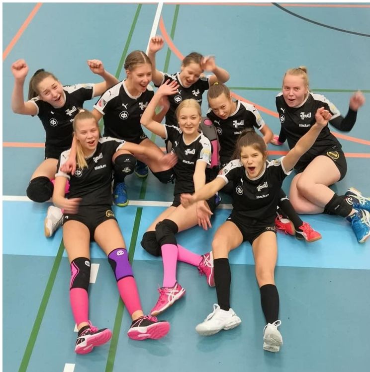
C-tytöt 2019 Kerimäellä. Kolme peliä, voitto jokaisesta