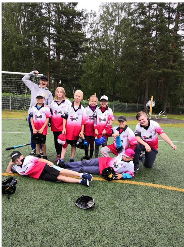
RautU:n pesiskoulu voitti juoksuin 20-11 Suonenjoella heinäkuun sateessa 2019

Vuonna 2003 harrastepesis hyytyi muutamaan tiistaivuoroon eikä pestuille saatu talkoolaisia. Vielä pari seuraavaa vuotta harrastepesis kärsi osallistujien vähydestä. Pesäpallojaosto varasi talvikaudeksi naisille lentopallovuoron.