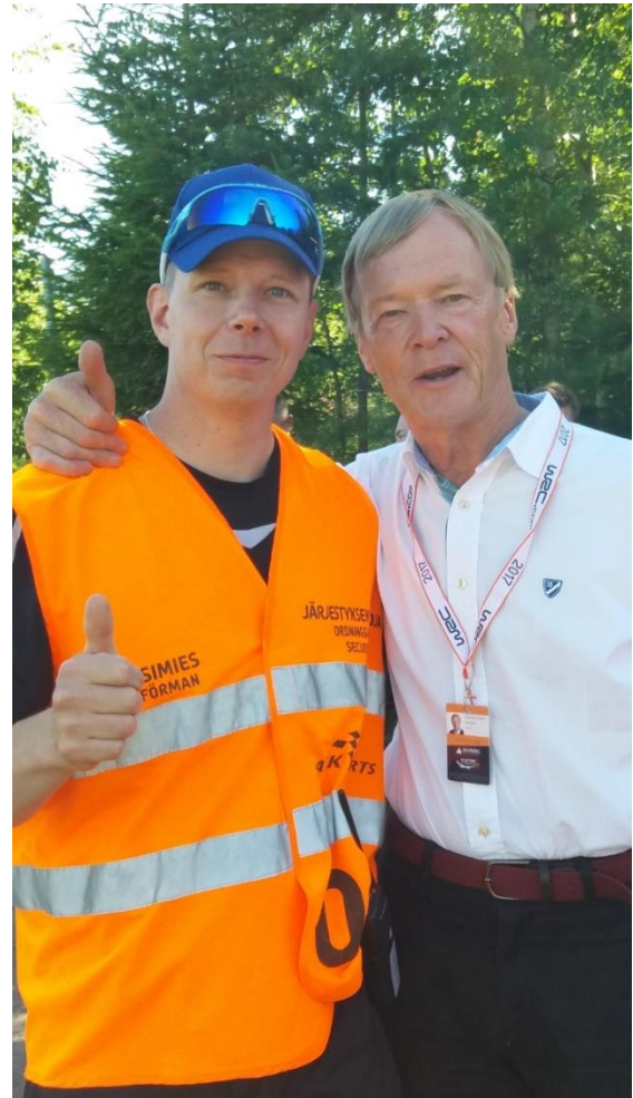
Järjestysvalvojina toimiminen on tärkeä tulonlähde

Merkittäviä tulonlähteitä vuosien varrella on ollut aurausviittojen pystyttäminen tieosuuksille sekä kahvitus yleisötilaisuuksissa. Esimerkiksi Neste Rallin pikataipaleilla, SM-jokkiksessa