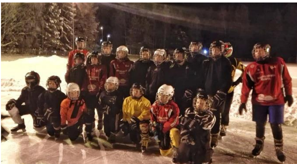
Vuoden 2019 ensimmäisissä junioriharjoituksissa oli 25 innokasta laskijaa