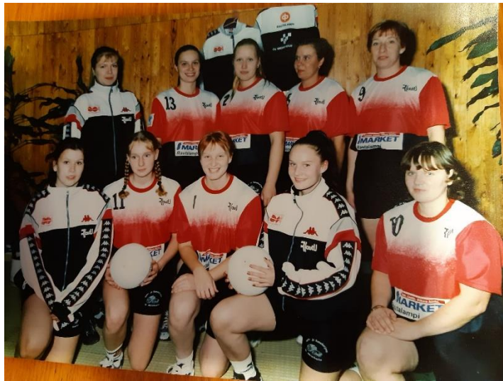
II-sarjalaisia 2000-luvun alussa uusissa pelipaidoissa

Kaudeksi 2006-07 sekä naiset että miehet päättivät olla osallistumatta sarjakauteen.